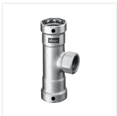
Megapress-Té avec SC-Contur modèle 4217.2 article 755 843