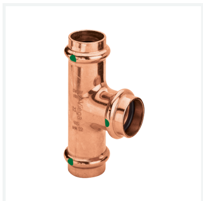
Profipress-Té avec SC-Contur modèle 2418 article 292 041