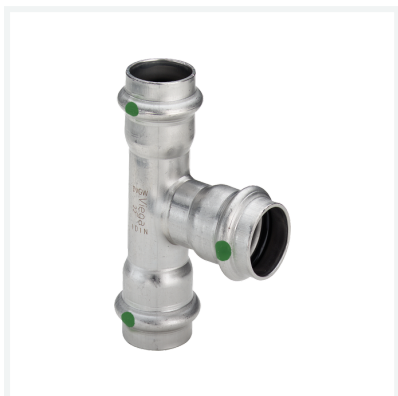
Sanpress Inox-Té avec SC-Contur modèle 2318 article 435 967