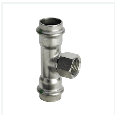
Sanpress Inox-Té avec SC-Contur modèle 2317.2 article 437 176