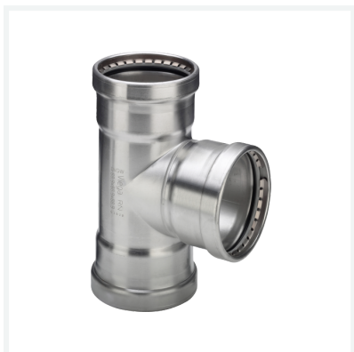
Sanpress Inox XL-Té avec SC-Contur modèle 2318XL article 482 718